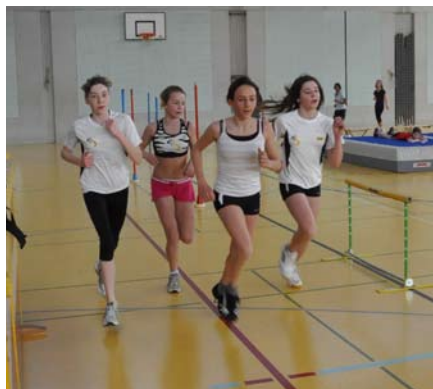
Alle gaben ihr Bestes

Am 20. März fand der jährliche LCS-Sponsorenlauf mit dem traditionellen Brunch in der Munot-Dreifachhalle statt. Für einmal stand nicht unbedingt die Leistung im Vordergrund. Die Athletinnen und Athleten versuchten in Zwei-