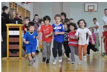
Die Kids beim Start zum Sponsorenlauf