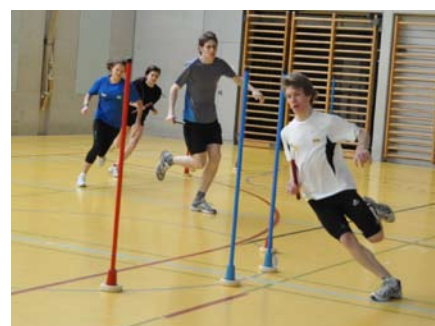
Vollgas auch um die engen Kurven